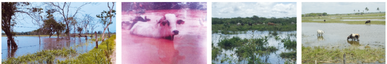
Figura 5. Potreros inundados y vacas en el agua en Tizimín, Yucatán (impacto de la tormenta tropical Cristóbal en junio de 2020 en el sur de México).

El cambio climático influye sobre el aumento en la frecuencia de fenómenos climáticos extremos en México afectando a familias rurales, principalmente. La estela de destrucción e inundaciones dejada por la tormenta tropical “Cristóbal” tras su paso en junio de 2020 por el sur de México, es un signo tangible del impacto del cambio climático sobre la ganadería en México (Figura 5). Potreros inundados, ganado en el agua y forrajes perdidos, son muestra evidente de que la alteración de los ciclos de la naturaleza por la actividad antropogénica, tiene consecuencias graves sobre el bienestar económico de miles de personas en el sector rural. Por tales razones, es indispensable que el país cuente con inventarios precisos de emisiones de gases de efecto invernadero y estrategias eficientes de mitigación y adaptación al cambio climático. El Plan Nacional de Desarrollo 2018-2024 no contiene un instrumento de política pública para tal efecto, por lo que es necesario diseñarla y ponerla en operación, so pena de pagar el precio social y económico de no haber tomado las medidas suficientes para mitigar los efectos del cambio climático.