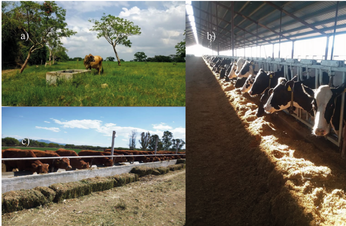
Figura 3. Diferentes sistemas de producción y alimentación del ganado bovino en México. (a) Pastoreo en las regiones de clima cálido sub-húmedo, (b) Engorda intensiva en corrales en la región de clima muy seco y (c) Producción intensiva de leche en la región de clima seco.

Mediante un análisis estadístico multivariado de las encuestas aplicadas, se identificaron los principales ingredientes empleados en la alimentación, y posteriormente, se definieron las dietas tipo para cada región geo-climática y categoría de ganado. Las dietas tipo se reprodujeron y ofertaron a bovinos experimentales y sus emisiones de metano fueron medidas en las cámaras de respiración de circuito abierto (Figura 4), de los laboratorios de la UAEMex y la UADY; es decir una dieta tipo para cada región climática y categoría de ganado. Las cámaras de respiración están equipadas con aire acondicionado, luz artificial, ventilador y una jaula metabólica; ésta última provista de comedero, bebedero, piso antiderrapante y un contenedor en la parte inferior posterior, que permitió la colecta total de heces del animal como se describe en Canul et al. (2017); esta infraestructura fue necesaria para el cálculo de consumo de materia seca (CMS) y digestibilidad de la dieta, además de la emisión de metano. Los animales tuvieron un periodo de adaptación a las dietas tipo, para posteriormente seguir con un periodo de muestreo, en el cual se realizaron mediciones de consumo, digestibilidad de la