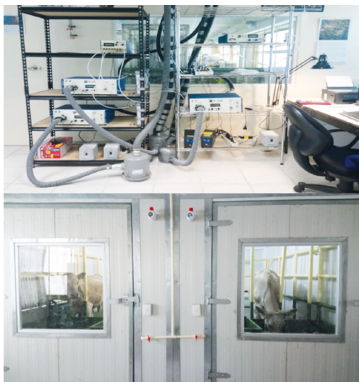
Figura 4. Equipo de medición de emisiones de metano y cámaras de respiración de circuito abierto de la FMVZ-UAEMex.

Finalmente, con los datos obtenidos: factor Y_m , digestibilidad y variables sobre las características productivas del animal, se calculó el inventario de emisiones de metano por región geo-climática, función productiva y categoría del ganado, acorde al modelo del Tier 2 (IPCC, 2006), utilizando como base el censo del Padrón Ganadero Nacional al año 2016. También, se determinó la magnitud de la incertidumbre asociada al modelo (Valenzuela et al. , 2017), y la propagación de la incertidumbre por el método de simulación